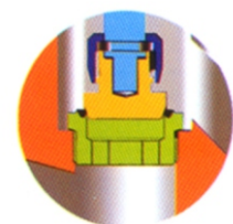
ASIENTO INTERCAMBIABLE ESTERILIZADO (OPCIONAL)